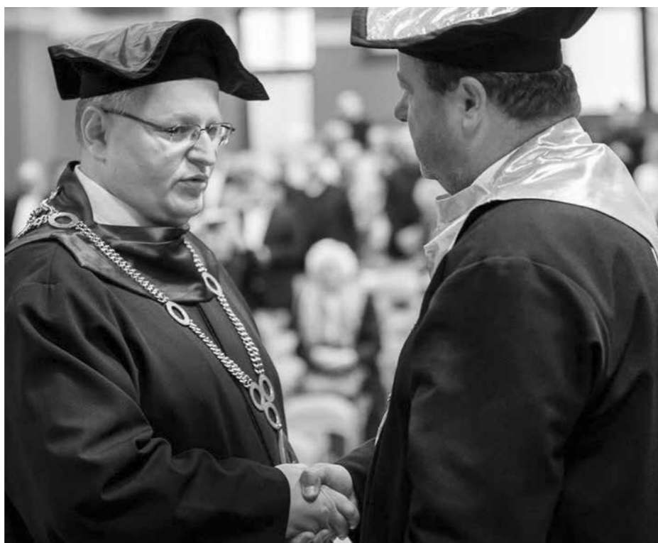
Dekanát TF KU