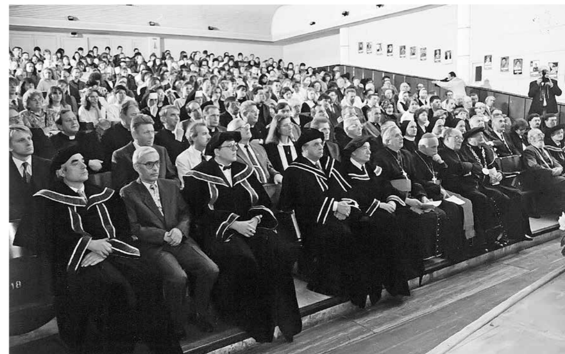
Slávnostné otvorenie Katecheticko-pedagogického inštitútu pri Trnavskej univerzite v Ružomberku.