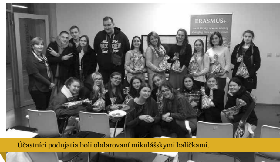
Účastníci podujatia boli obdarovaní mikulášskymi balíčkami.

Dva dni pred sviatkom Sv. Mikuláša usporiadal Referát pre zahraničné vzťahy a mobility KU podujatie pre všetkých zúčastencov, osobitne pre domácich a zahraničných poslucháčov. „ Katolícka univerzita v Ružomberku je aktívna v medzinárodných vzťahoch, internacionalizuje domáce prostredie aj tým, že cez neformálne stretnutia umožňuje členom akademickej obce dozvedieť sa viac o kultúre, zvykoch a živote v bližších i vzdialenejších krajinách. Týmto stretnutím sme im chceli priblížiť slávenie