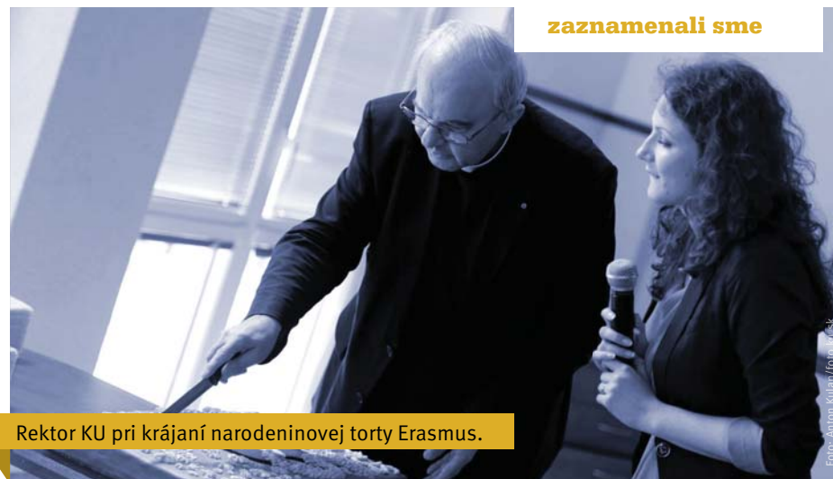
Rektor KU pri krájaní narodeninovej torty Erasmus.