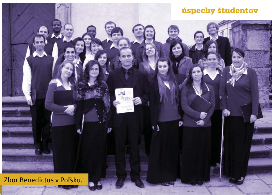
Zbor Benedictus v Poľsku.