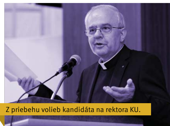
Z priebehu volieb kandidáta na rektora KU.

Áno, súhlasím. Priestor na rozhovor však nie je dostatočne veľký na to, aby sme sa každej programovej vízii venovali detailne. Ktokoľvek si však môže program rektora prečítať na internetovej stránke univerzity, kde som