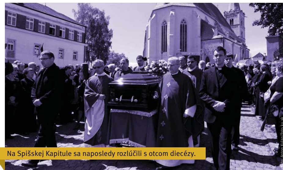
Na Spišskej Kapitule sa naposledy rozlúčili s otcem diecézy.

„S univerzitou bol aj v neľahkých časoch, kedy sme zažívali útoky z rôznych strán, bojovali o svoje miesto vo vysokom školstve na Slovensku. Bol s nami v obdobiach, kedy sme sa spoločne tešili prvým úspechom, zažívali uznanie a radovali sa z rozvojových projektov, ktoré sme podnikali. Keď mohol, vždy bol pripravený pomôcť,“ spomína rektor. Podľa neho to dokumentuje aj zápal a pracovitosť otca biskupa v biskupskej a v päťdesiatročnej kňazskej službe. „K Nebeskému Otcovi odchádza priateľ univerzity, zaniatený vysokoškolský profesor KU a otec diecézy,“ konštatuje v liste rektor.