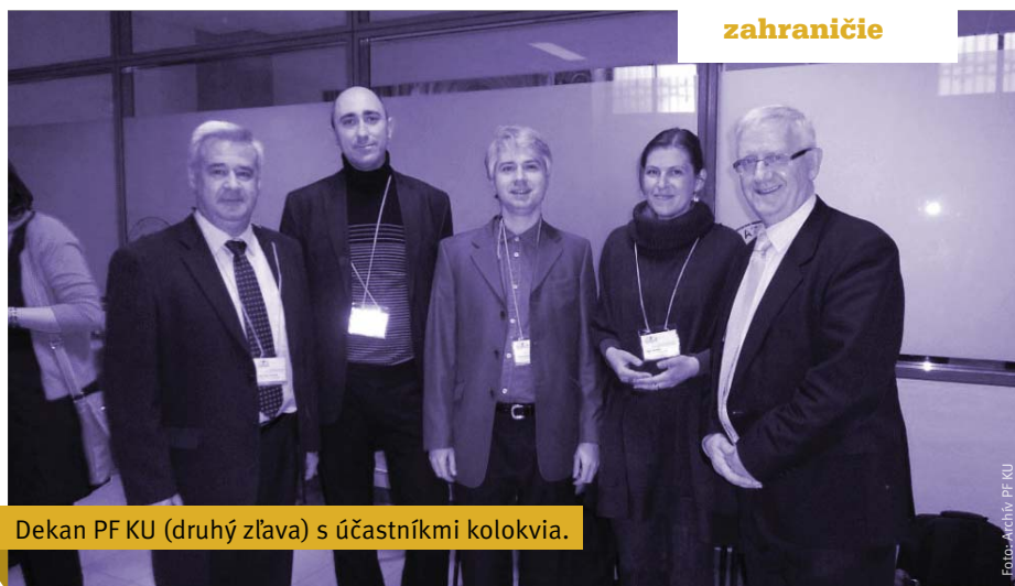
Dekan PF KU (druhý zľava) s účastníkmi kolokvia.

Hlavná téma 23. kolokvia ACISE spájajúca jednotlivé príspevky prednášajúcich poukázala na to, ako sa stať učiteľom odpovedajúcim na výzvy, ktoré v súčasnosti prináša nová spoločnosť. Kolokvium bolo tematicky rozdelené do týchto hlavných okruhov: edukačné modely a projekty v príprave učiteľov, profil učiteľov formovaných na katolíckych univerzitách, vzdelávacie kurikulum a jeho obsah, vzdelávacie aktivity, metodológie a miesto praktických skúseností v príprave budúcich učiteľov, spôsoby pedagogickej evalvácie, súčasná štruktúra prípravy budúcich učiteľov v celosvetovom spoločenskom kontexte. Počas trvania kolokvia odzneli zo strany jeho účastníkov aj pozitívne ohlasy na 21. výročné kolokvium, ktoré sa konalo v roku 2010 pod záštitou Katolíckej univerzity v Ružomberku práve na Pedagogickej