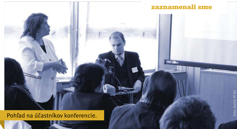
Pohľad na účastníkov konferencie.

Nosnú časť konferencie tvoril koncept trvalo udržateľného rozvoja sociálnych služieb ako možné východisko riešenia nepriaznivých dôsledkov globálnych trendov vývoja spoločnosti. V rámci toho bol dôraz kladený na ekonomické kategórie a sociálne ciele, ktoré sa týkajú kvality života, redukcie chudoby a iných problémov. Okrem tejto problematiky bola konferencia zameraná na problematiku komplexného a synergického procesu ovplyvňujúceho kultúrne, sociálne, ekono-