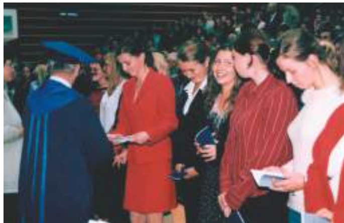
Slávnostná imatrikulácia Otvorenie akademického roka 21.9.2004 na FF KU