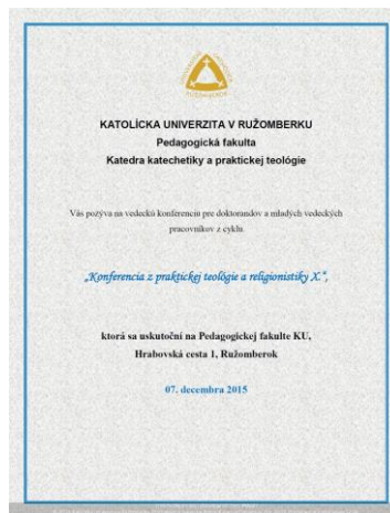
Obr. č. 1: KONFERENCIA Z PRAKTICKEJ TEOLÓGIE A RELIGIONISTIKY X