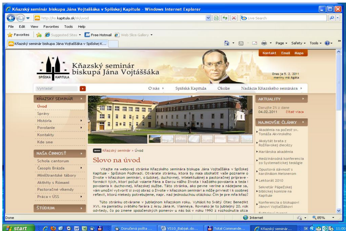
Web stránka Kňazského seminára biskupa Jána Vojtáššáka v Spišskej Kapitule