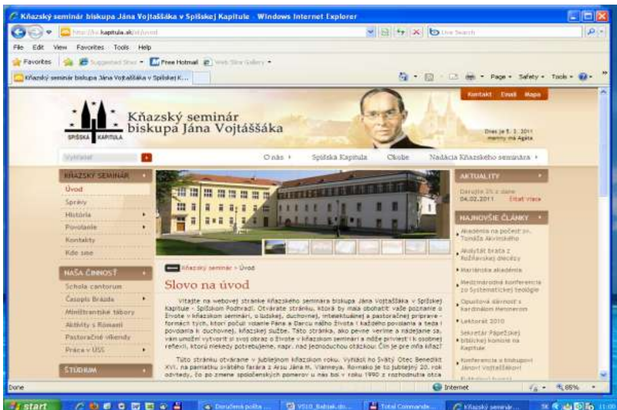
Web stránka Kňazského seminára biskupa Jána Vojtáššáka v Spišskej Kapitule