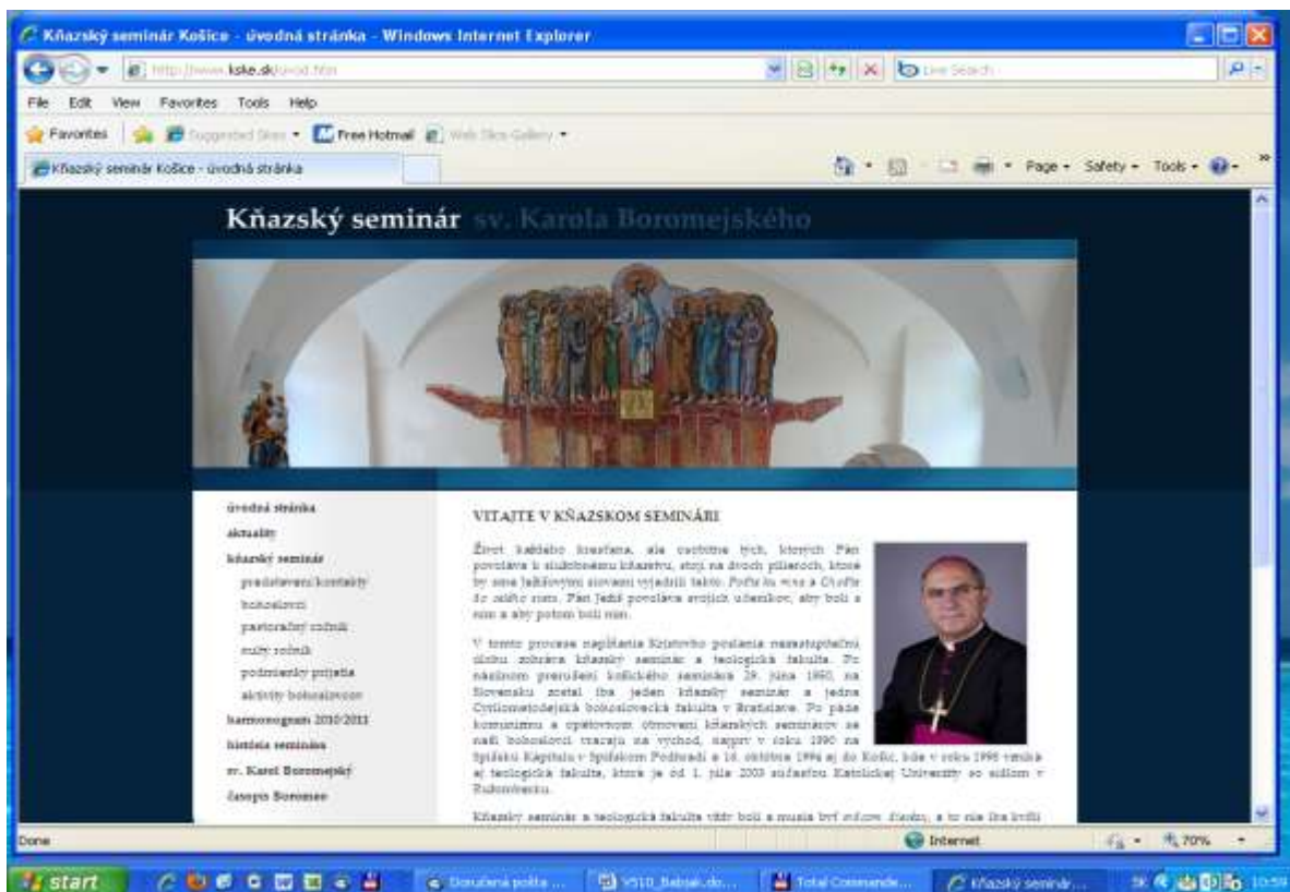
Web stránka Kňazského seminára sv. Karola Boromejského v Košiciach