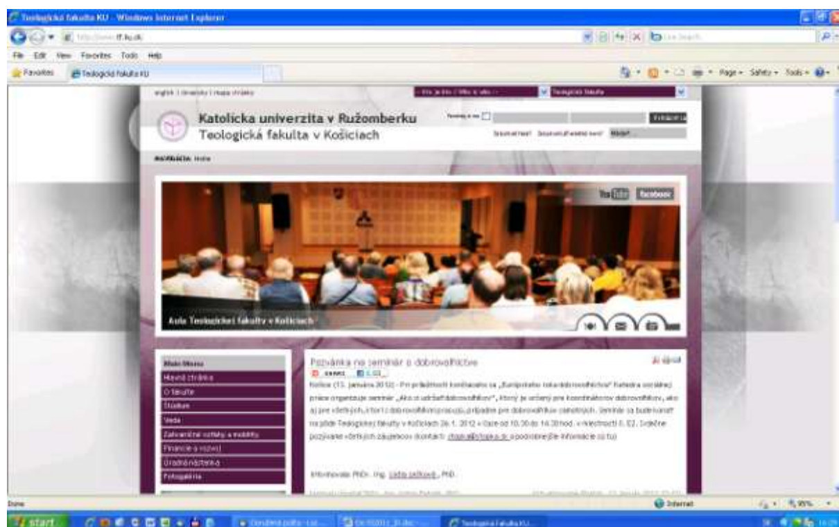
Web stránka Teologickej fakulty

Vzhľad web stránok tf.ku.sk , www.kske.sk , ks.kapitula.sk a www.institutrodiny.sk je na nasledujúcich obrázkoch: