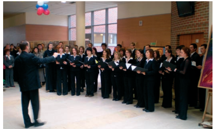
Vystúpenie univerzitného zboru Benedictus.