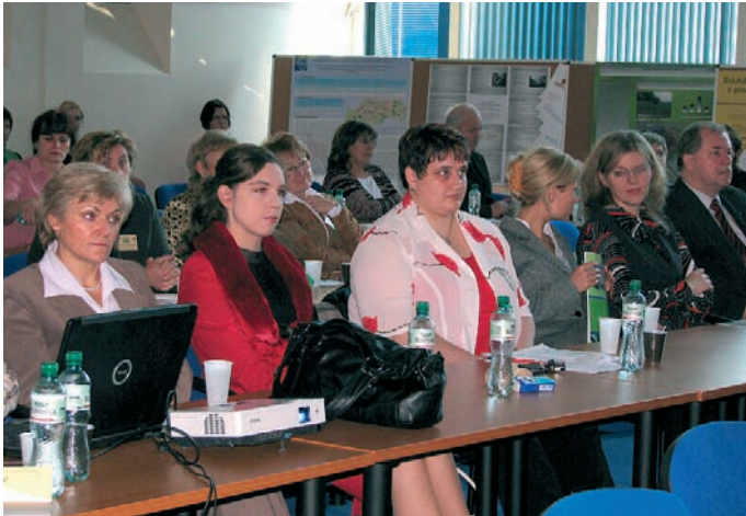
Pohľad na účastníkov Ružomerských zdravotníckych dní.