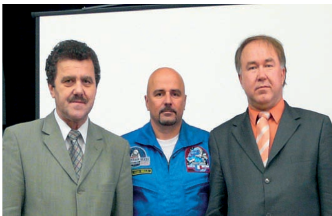
Ivan Bella s autormi článku.

Dňa 27. novembra sa v rámci Európskeho týždňa vedy uskutočnila na Katolíckej univerzite v Ružomberku (KU), v Aule Jána Pavla II., prednáška Človek a vesmír – Vojenská vesmírna misia letca – kozmonauta plk. Ing. Ivana Bellu. Cieľom prednášky bolo oboznámiť prítomných s vesmírnou misiou prvého slovenského kozmonauta, plukovníka Generálneho štábu Armády Slovenskej republiky Ivana Bellu, ktorý absolvoval kozmický let 20. 2. 1999 vo vesmírnej lodi SOJUZ TM 29. Celková dĺžka letu bola 7 dní 21 hodín a 56 minút. I. Bella sa stal takto v poradí 385. človekom vo vesmíre. Slovenský kozmonaut počas letu medzinárodnej posádky (francúzsko – rusko – slovenskej) realizoval 6 vedeckých projektov v rámci programu Štefánik.