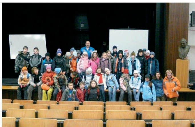
Osudy kozmonauta nadchli najmä školákov.

– programátor. Lietal na strojoch MiG-21 a SU-22. V marci 1998 odišiel do moskovského Hviezdneho Mestečka, kde sa začal pripravovať na vesmírny let. V auguste 1998 vybrali Ivana Bellu za člena hlavnej rusko-francúzsko-slovenskej posádky 27. expedície na stanici Mir. V nej pôsobil ako kozmonaut-výskumník v rámci vedeckého programu Štefánik. Po ukončení letu pracoval ako pridelenec obrany na veľvyslanectve SR v Moskve (do roku 2007). V súčasnosti pôsobí ako veliteľ posádky v Bratislave.