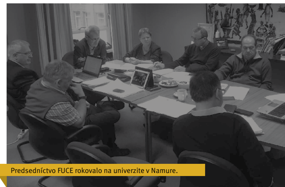
Predsedníctvo FUCE rokovalo na univerzite v Namure.

V druhý deň sa členovia predsedníctva zaoberali organizáciou budúceho Generálneho zhromaždenia FUCE, ktoré sa uskutoční v Portugalsku. Hostiteľom bude Katolícka univerzita v Lisabone, ktorá osláví 50. výročie svojho založenia. Výber Portugalska je spojený aj so 100. výročím zjavení Božej Matky vo Fatime. Počas spojenia za pomoci skypu prebehlo rokovanie s prorektorom Katolíckej univerzity v Lisabone. Rokovanie sa dotýkalo organizačného zabezpečenia, výberu prednášok a prednášateľov a celkového usporiadania programu. Ďalšími bodmi rokovania predsedníctva FUCE bolo posúdenie kritérií štipendia pre študentov z Libanonu a Ukrajiny, aktuálna finančná situácia FUCE a otázka prijatia nových členov, konkrétne z Albánska.