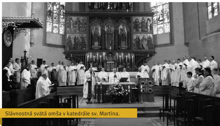
Slávnostná svätá omša v katedrále sv. Martina.