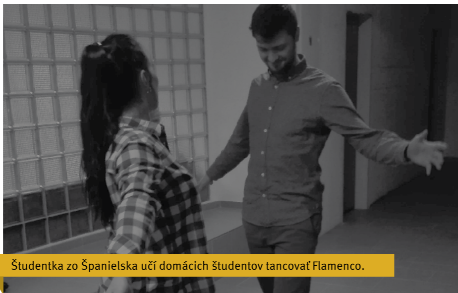
Študentka zo Španielska učí domácich študentov tancovať Flamenco.

V novembri mali študenti možnosť bližšie spoznať Ukrajinu a temperament Španielska a Talianska, cez študentky z univerzít Università per Stranieri di Perugia, Universidad Católica de Ávila a Polonia University in Czestochowa. Veľký úspech priniesol krátky kurz flamca a ukrajinská ná-