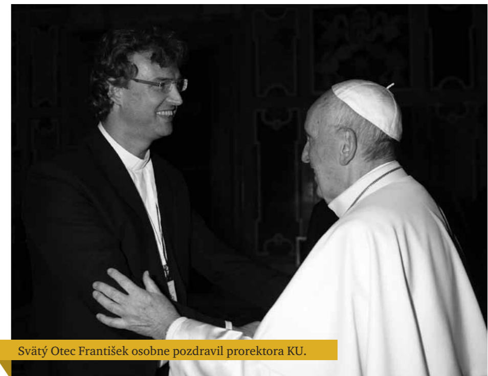
Svätý Otec František osobne pozdravil prorektora KU.

Vyvrcholením štvordňového podujatia bola osobitná pápežská audiencia vo štvrtok 1. decembra, počas ktorej všetkých účastníkov kongresu prijal vo Vatikáne v Klementínskej sále Svätý Otec František a osobne sa pozdravil s každým účastníkom kongresu.