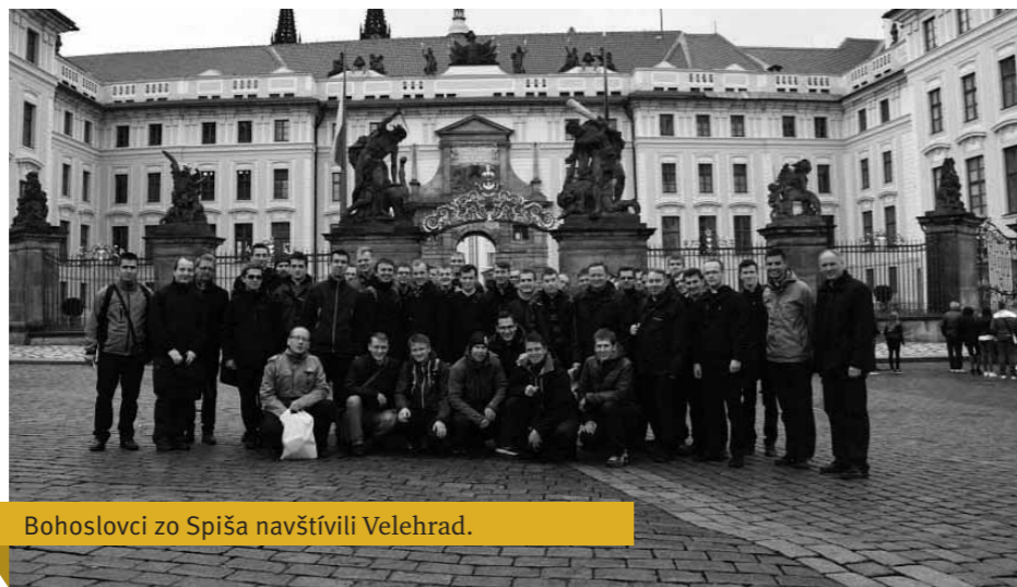
Bohoslovci zo Spiša navštívili Velehrad.