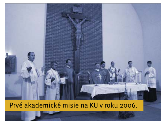
Prvé akademické misie na KU v roku 2006.