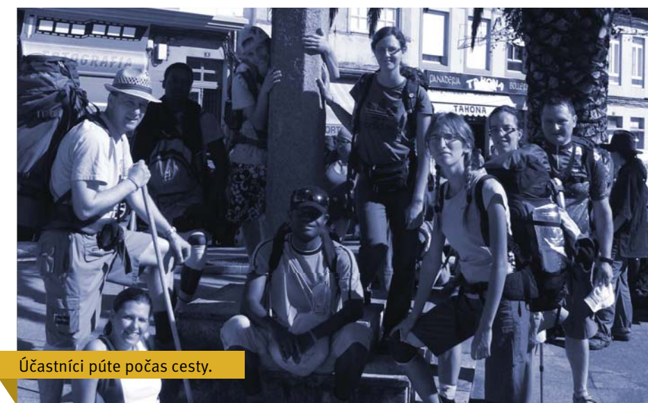
Účastníci púte počas cesty.