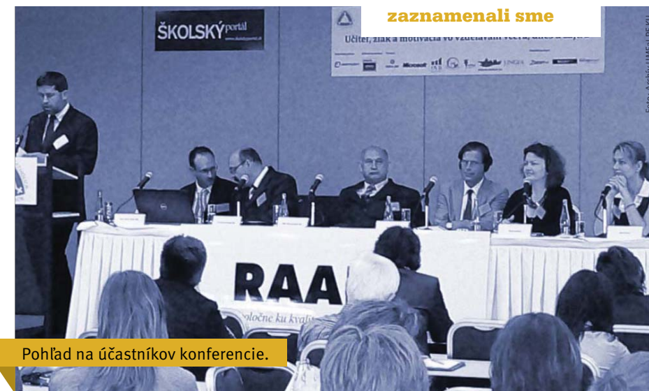
Pohľad na účastníkov konferencie.

Cieľom konferencie bolo poukázať na zmenu osobnosti dnešného žiaka v posledných rokoch v oblasti jeho záujmov, motivácie a potrieb učiť sa. Vďaka bohatej medzinárodnej účasti mohol každý účastník porovnať kvalitu vzdelávacieho