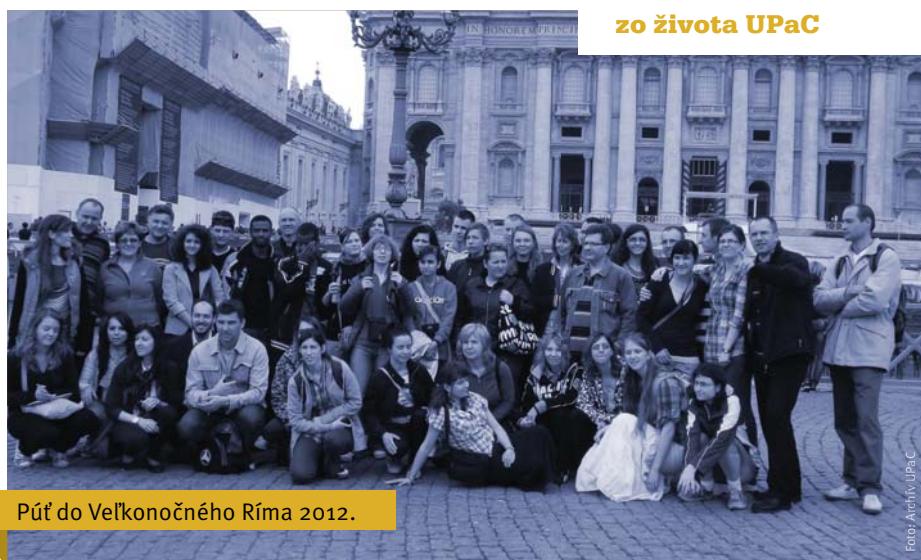
Púť do Veľkonočného Ríma 2012.