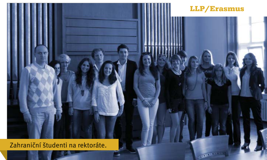
Zahraniční študenti na rektoráte.