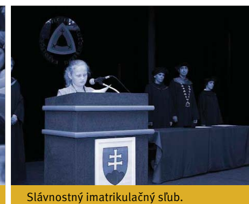
Slávnostný imatrikulačný sľub.