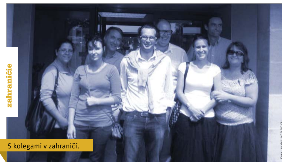
S kolegami v zahraničí.

Počas letných mesiacov vo francúzskej komunite L'Arche (v meste Agen a Cognac) pôsobili štyri študentky PF KU, poslucháčky študijných odborov sociálna práca a špe-