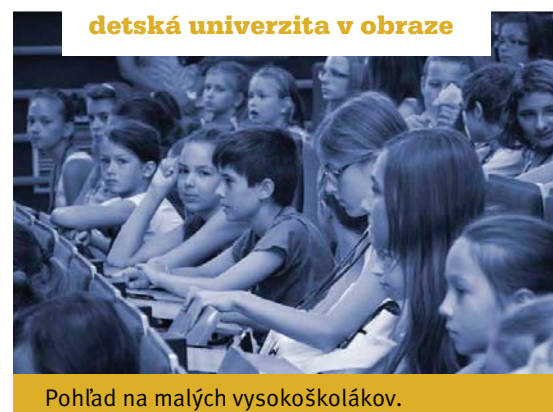
detská univerzita v obraze