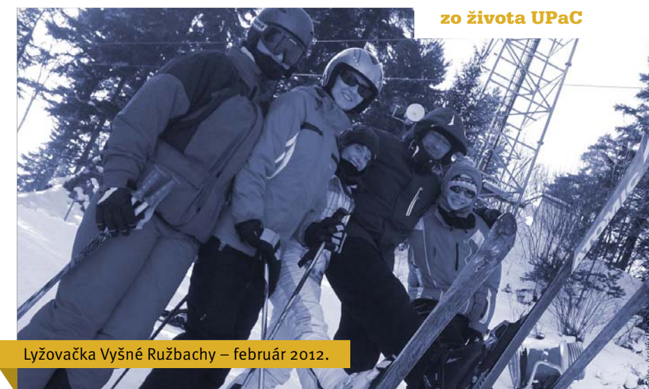
Lyžovačka Vyšné Ružbachy – február 2012.

UPaC všetky svoje podujatia a aktivity okrem univerzitných nástieniek zverejňuje na internetovej stránke: www.upac.sk . V tomto novom akademickom roku chceme v UPaC Jána Vojaššáka: - postaviť do centra univerzitného života Ježiša Krista,