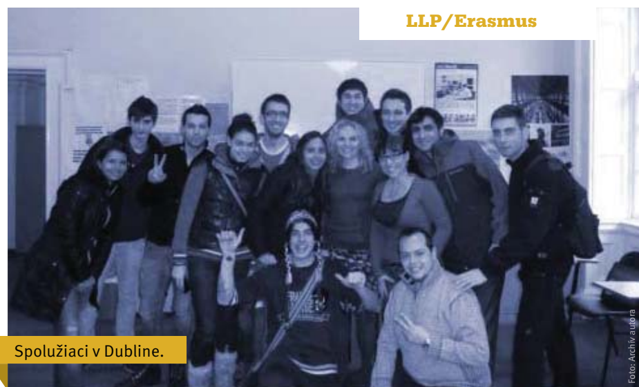
Spolužiáci v Dubline.