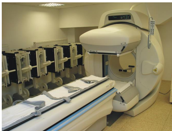
Pracovisko nukleárnej medicíny