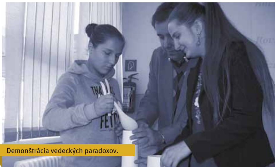
Demonštrácia vedeckých paradoxov.