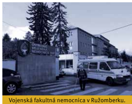
Vojenská fakultná nemocnica v Ružomberku.