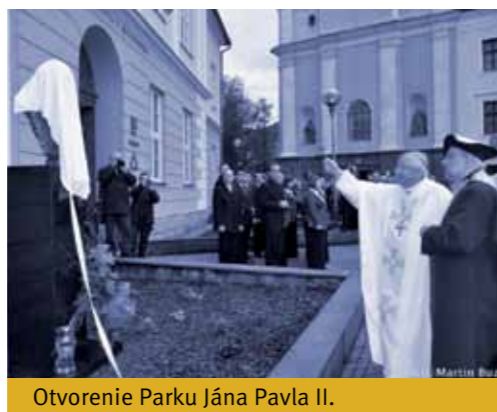
Otvorenie Parku Jána Pavla II.