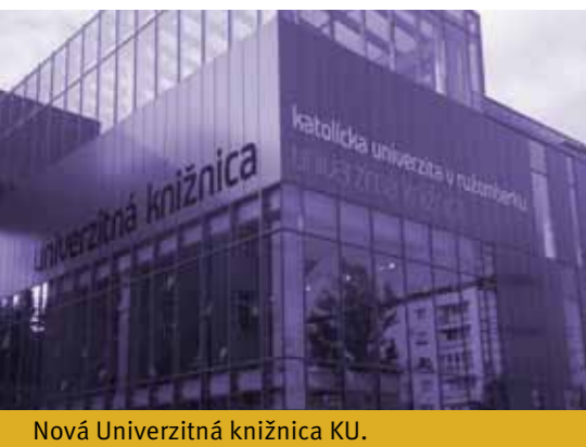
Nová Univerzitná knižnica KU.