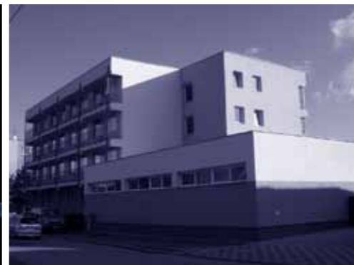
Zrekonštruovaný študentský domov Ruža.