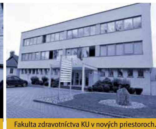
Fakulta zdravotníctva KU v nových priestoroch.