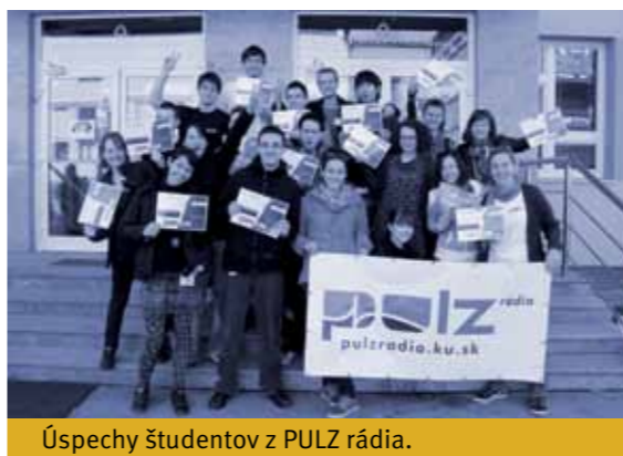
Úspechy študentov z PULZ rádia.

O možnostiach budúcej spolupráce rokovali v pondelok 17. mája 2010 zástupcovia z Katolíckej univerzity v Ružomberku s predsedom Talianskej biskupskej konferencie kardinálom Angelom Bagnasciom. Kardinál Bagnasco sa zaujímal o súčasnosť univerzity, jej aktuálne rozvojové projekty a budúcnosť a bol mu predstavený projekt výstavby univerzitnej knižnice.