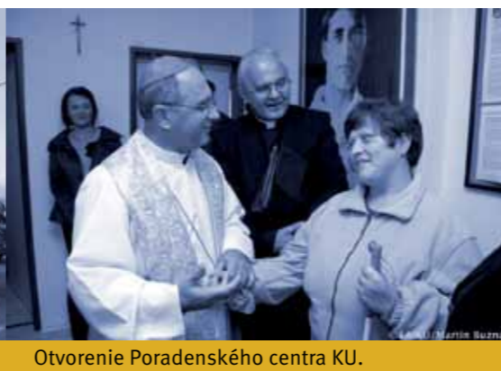
Otvorenie Poradenského centra KU.