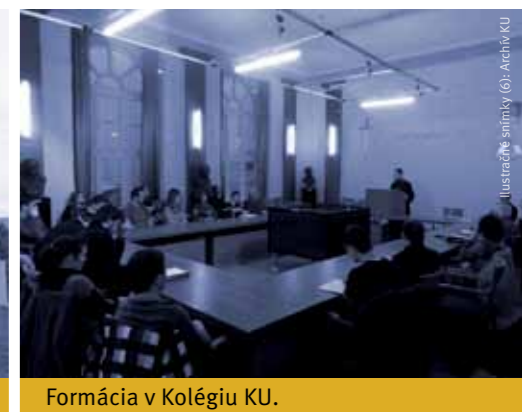
Formácia v Kolégiu KU.