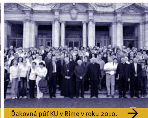
Ďakovná púť KU v Ríme v roku 2010. →