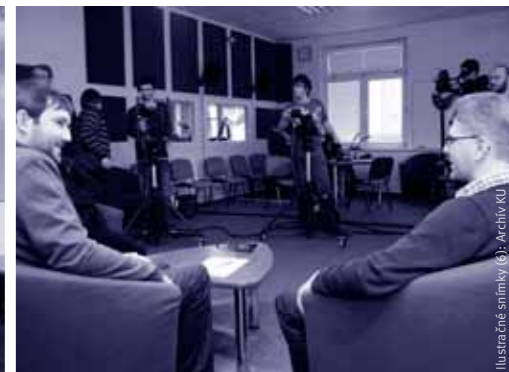
Vynovené univerzitné mediálne centrum.