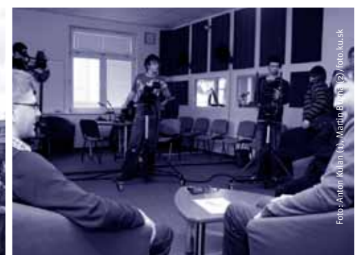
Univerzitné TV štúdio.