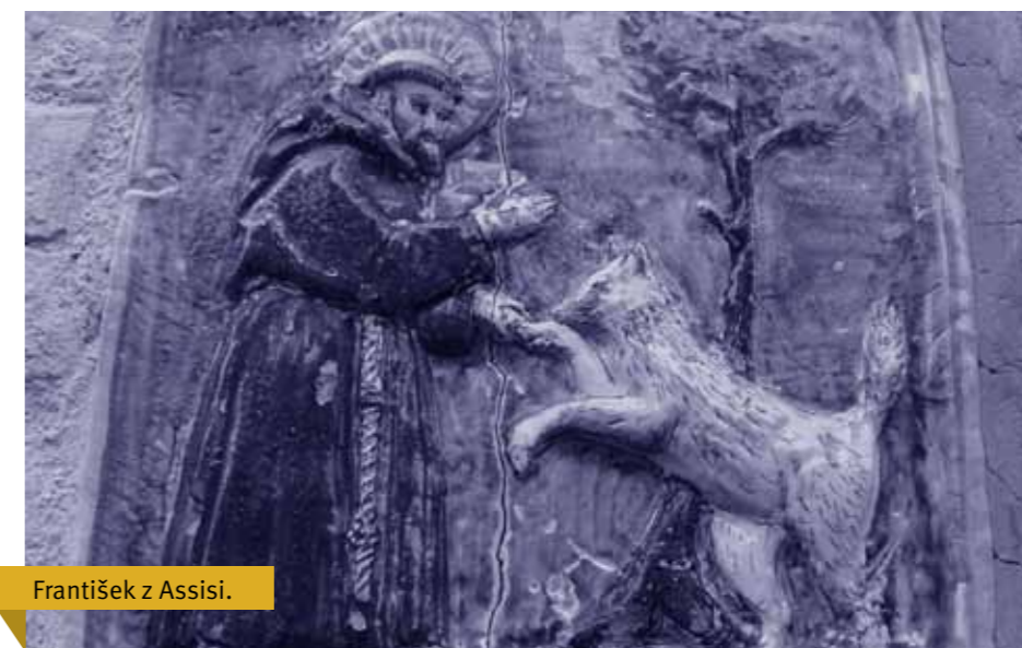
František z Assisi.