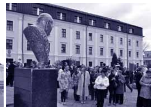
Otvorenie Parku Jána Pavla II.