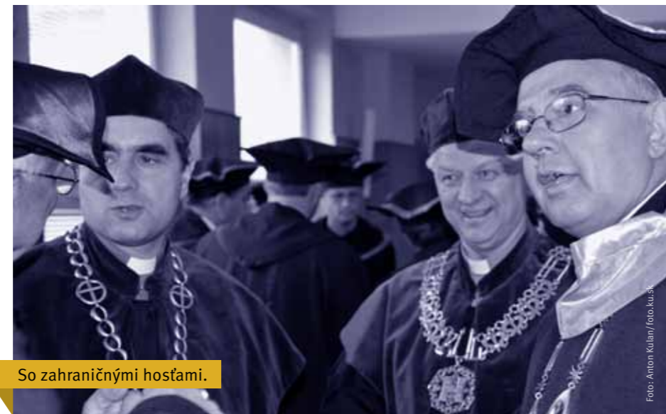
So zahraničnými hosťami.

ra 2012 na Nedelu Katolíckej univerzity v kostoloch, ste spomínali prorocké úlohy univerzity v spoločnosti. Aké je teda postavenie univerzity vo vzťahu ku Katolíckej cirkvi či k zriaďovateľovi Konferencii biskupov Slovenska? Záleží nám na tom, aby bola Katolícka univerzita vnímaná biskupmi, kňazmi i veriacimi ako potrebná a prospešná inštitúcia. Teším sa z každého záujmu otcov biskupov o univerzitu. Pravidelne ich navštevujem a informujem o našej činnosti. Ovocím vzájomnej spolupráce, prejavom dôvery a veľkorysosti bolo zavedenie Nedele Katolíckej univerzity. Biskupi v pastierskom liste z roku 2010 vyjadrili nádej, aby sa v tento deň veriaci na Slovensku modlili za svoju jedinou Katolícku univerzitu. Vo farnostiach sa v deň venovaný univerzite môže čítať list rektora, môžu sa organizovať Kluby priateľov KU... V roku 2012 sa zároveň uskutočnila už tretia zbierka na podporu Katolíckej univerzity, ktorej výťažok opäť využijeme na výstavbu novej univerzitnej knižnice.