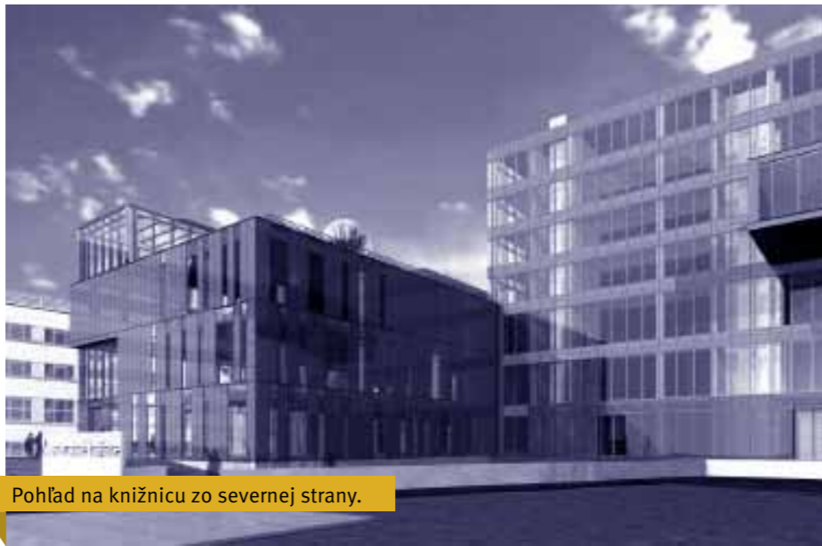
Pohľad na knižnicu zo severnej strany.

V novej knižnici nájdeme aj druhé Rusko umelecké dielo s názvom Otče náš (5x12m) – plotrovaný text osadený na farebných plexisklách, ktoré bude umiestnené oproti vstupu do budovy na prvých troch podlažiach. Pre úplnosť dodajme, že štúdiu a následne projekt interiéru UK KU spracoval Ing. arch. Stanislav Šutvaj. Podrobné informácie o projekte i postupe výstavby nájdete na webe kniznica.ku.sk.