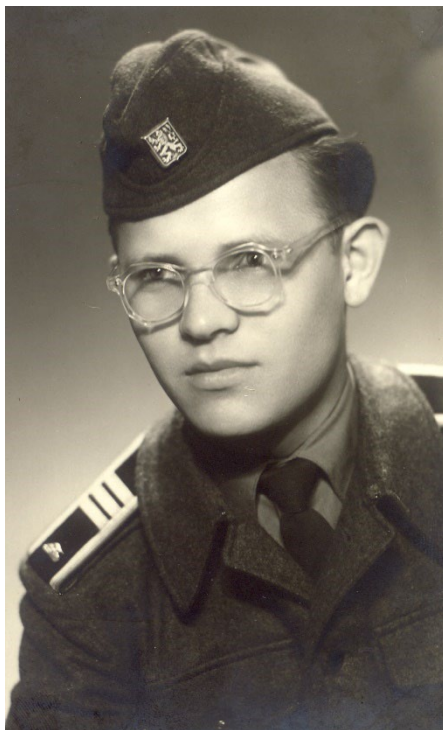
Základná vojenská služba 1957 – 58

Po návrate z vojenskej služby som v plnom rozsahu zapadol do obvyklej rutiny konca semestra, čo znamenalo udeľovanie zápočtov, prípravu, opravu a hodnotenie písomných úloh k semestrálnym skúškam, úplnú agendu skúšok z proseminára