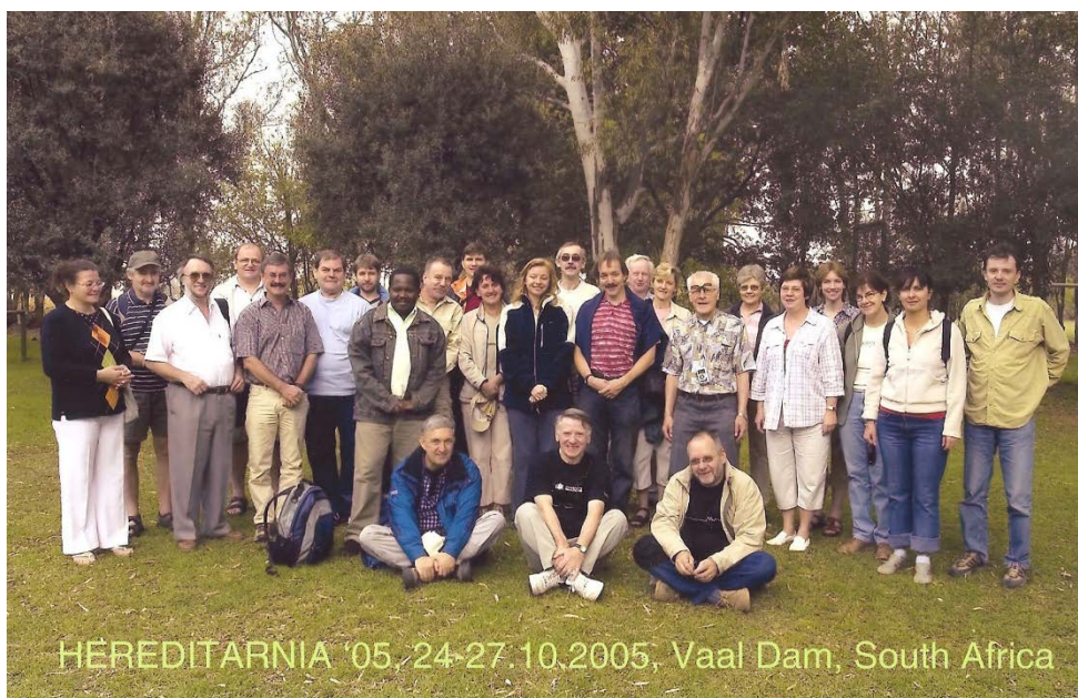
HEREDITARNIA '05, 24-27. 10. 2005, Vaal Dam, South Africa

Účastníci konferencie "Hereditarnia 2005" v Južnej Afrike.