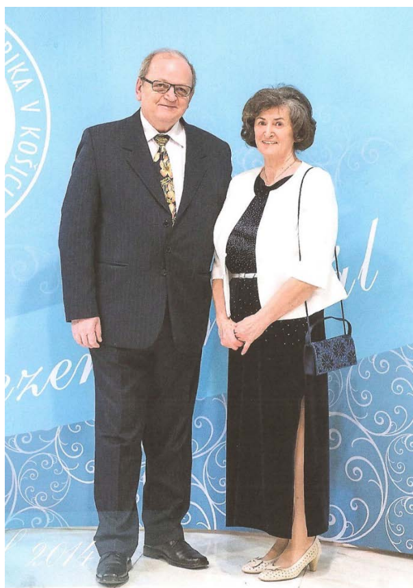
S manželkou na univerzitnom plese v roku 2014.