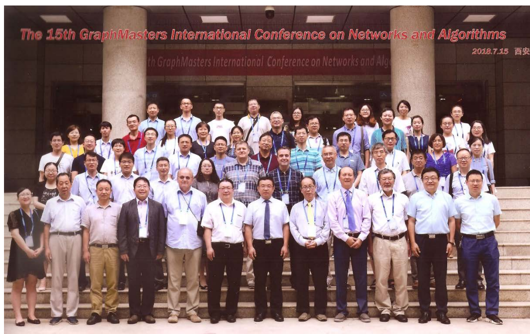
Na konferencii v Číne v roku 2018.