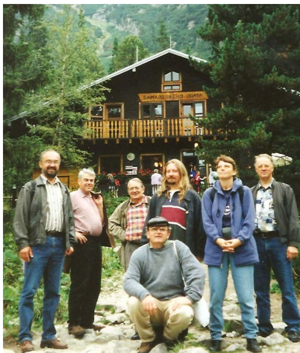
S nemeckými kolegami na Zamkovského chate vo Vysokých Tatrách.