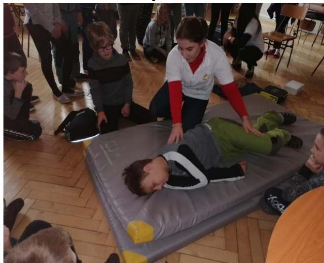
Účast' na ŠVOČ