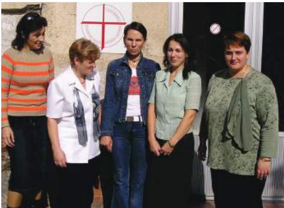
Pedagógovia katedry ošetrovateľstva

Popri pedagogickej činnosti medzi hlavné poslanie Pedagogickej fakulty patrí nezávislá vedeckovýskumná a umelecká činnosť. Vedeckovýskumné aktivity na