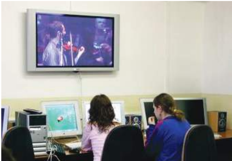
Mediálne laboratórium FF KU

Cieľom oddelenia pre zahraničné vzťahy Filozofickej fakulty Katolíckej univerzity v Ružomberku je umožniť študentom univerzity získať nové poznatky, skúsenosti a vedomosti na zahraničnej univerzite. Pre študentov je to možnosť uplatniť sa v ich budúcom živote nielen na národnej ale predovšetkým na medzinárodnej úrovni. V rámci zahraničnej spolupráce sa Filozofická fakulta Katolíckej univerzity v Ružomberku orientuje na mobilitu študentov ale nezanedbateľnou súčasťou je aj mobilita pedagógov. Učiteľia a študenti Filozofickej fakulty Katolíckej univerzity v Ružomberku môžu využívať a využívajú taktiež spoluprácu organizovanú na báze bilaterálnych dohôd podpísaných medzi KU a európskymi univerzitami v rámci