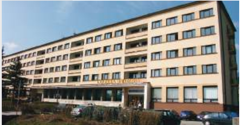
Prvá budova rektorátu na Hrabovskej ceste

Perspektíva univerzity bude závisieť od jej schopnosti udržať si svoje špecifikum - katolícku identitu a súčasne aj kvalitu vzdelávania. Obidve otázky budú stále náročnejšie a náročnejšie. Rastie počet mladých učiteľov, ktorí majú ambície plniť obidve tieto úlohy rovnako dobre ako iné katolícke univerzity vo svete, a to aj napriek problémom, s ktorými naše vysokoškolské vzdelávanie zápasí. Univerzita prekonala mimoriadne vysoký nárast v počte študentov i otváraných študijných disciplín. Prevzala tým na seba veľkú zodpovednosť voči študentom i spoločnosti. Nástup vysokoškolskej reformy poskytol univerzite šancu rovnakých východiskových pozícií, aké majú aj ostatné vysoké školy, a je potrebné túto šancu aj využiť. Ukazuje sa, že viaceré kolektívy popri obsahovej prestavbe v plnej miere začínajú využívať i nové technologické možnosti predovšetkým v oblasti informačných technológií. Šancou pre univerzitu je aj jej pridruženie do federácie katolíckych univerzít v Európe a vo svete. Treba sledovať smerovanie týchto federácií a stať sa aktívnym účastníkom na tvorbe a realizácii ich plánov. História nás učí, že veľké diela – a takým je aj budovanie univerzity – sa nedajú uskutočniť bez ľudí zapálených pre vec, verných ideálom a ochotných aj osobných obetí. Verím, že Pán bude požehnávať univerzitu takými ľuďmi aj v budúcnosti.