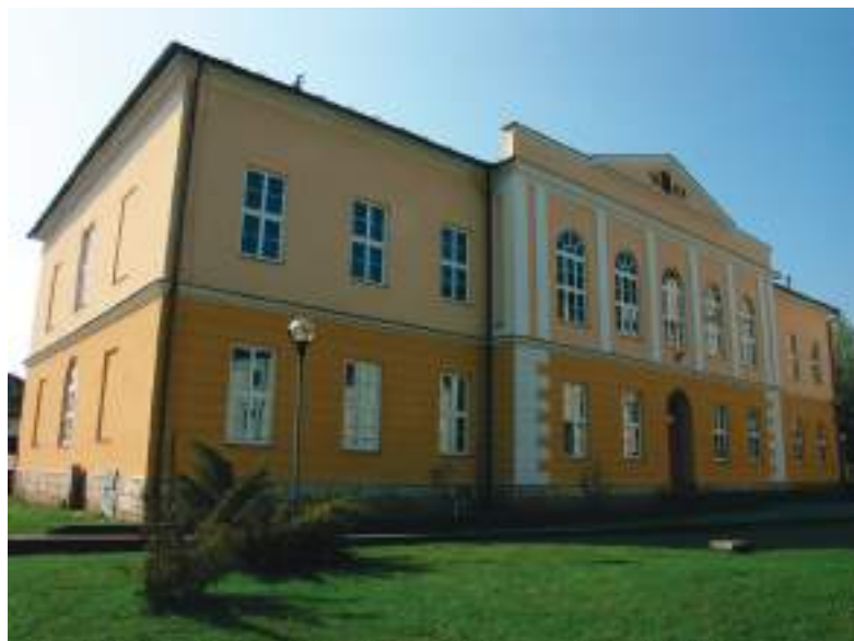
Budova rektorátu na Námestí Andreja Hlinku v Ružomberku