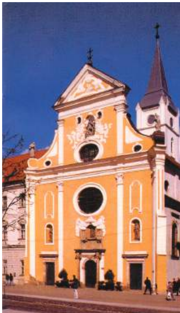
Seminárny kostol v Košiciach

Tridentský koncil v roku 1563 prijal dekrét Quam adolescentium aetas, v ktorom určil každému diecéznemu biskupovi povinnosť založiť vo svojej diecéze kňazský seminár.