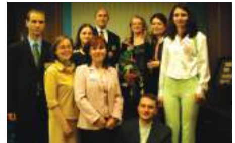
Organizačný tím konferencie