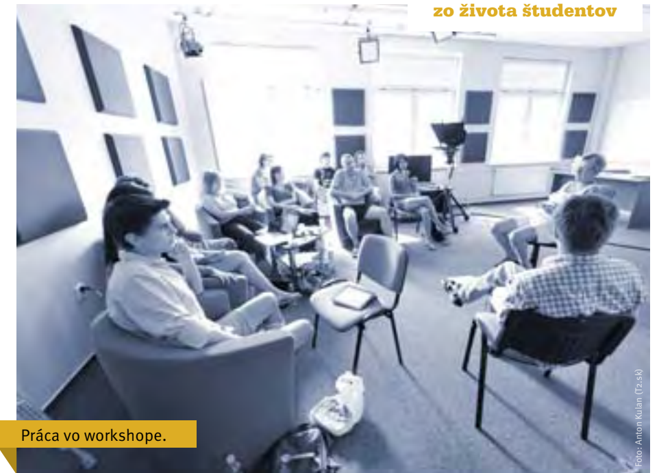
Práca vo workshope.

„Moja metóda je multižánrová, multifunkčná, takže sme písali nielen perom, ale aj nohami, rukami, sluchom, očami, dokonca celým telom, lebo sme aj tanco-