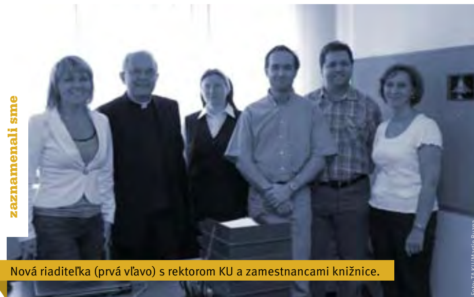
Nová riaditeľka (prvá vľavo) s rektorom KU a zamestnancami knižnice.