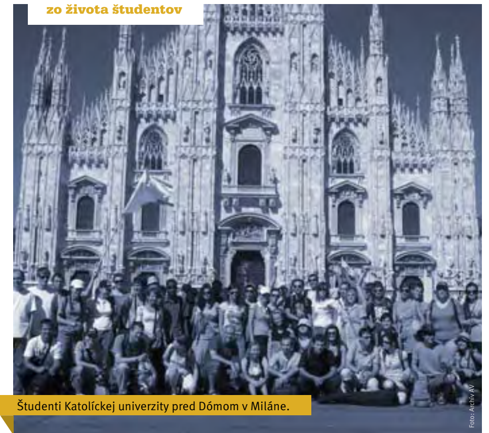
Študenti Katolíckej univerzity pred Dómom v Miláne.