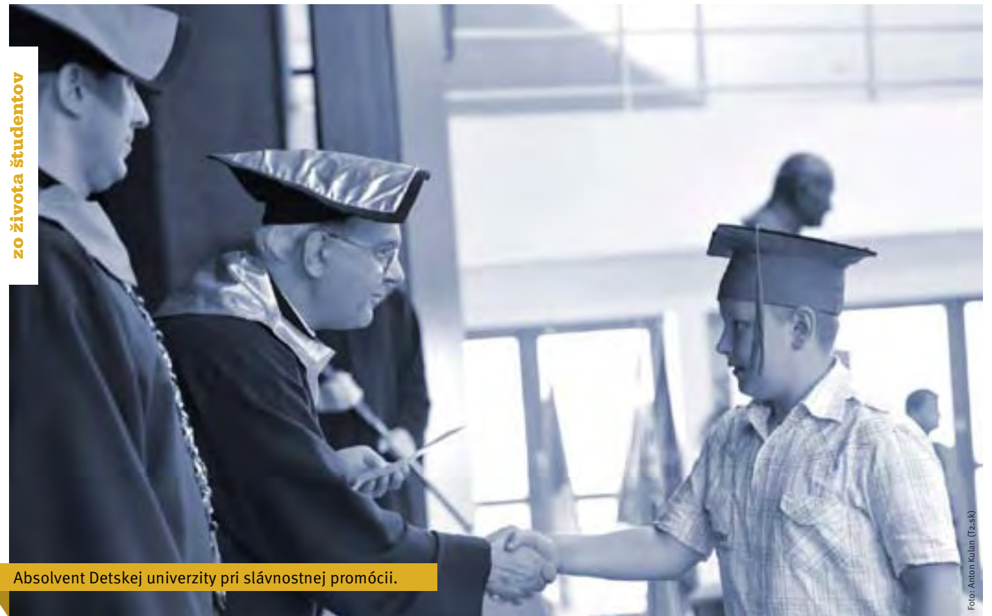
Absolvent Detskej univerzity pri slávnostnej promócií.