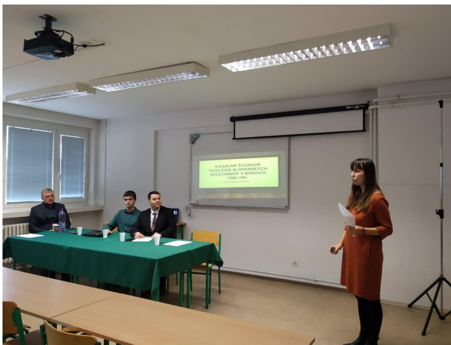
Obrázok č. 2– Študentská konferencia